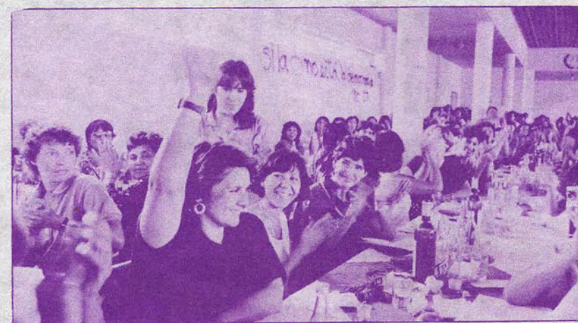
Muchas pobladoras estuvieron allí presentes, así como mujeres de delegaciones extranjeras. En la foto, la representante de la delegación italiana.