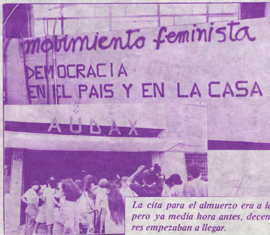
La cita para el almuerzo era a las 13 horas, pero ya media hora antes, decenas de mujeres empezaban a llegar.

Así nos sumamos a las numerosas actividades con que todas las mujeres en Chile celebraron el Día Internacional de la Mujer.