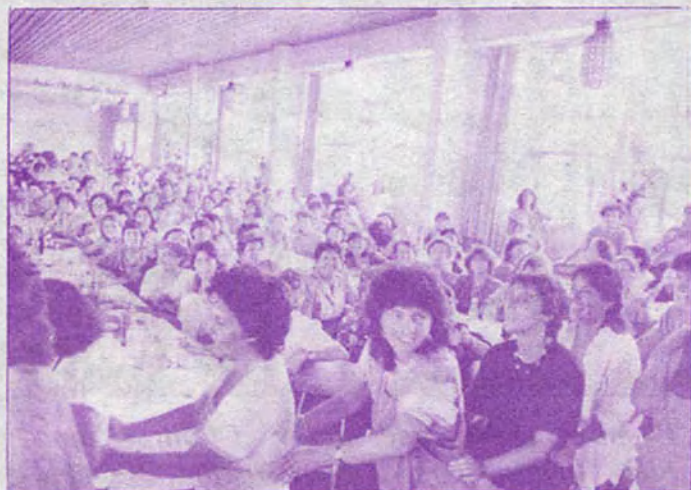
Y así celebramos el Día Internacional de la Mujer: con risas, llanto, alegría, unidad y, todas juntas, tomadas de la mano, bailando y cantando "María, María"... Fue un encuentro que llamó la atención por su numerosa concurrencia, su tono alegre y acogedor, su espíritu abierto y unitario, y su valioso aporte a las reivindicaciones de los movimientos de mujeres.